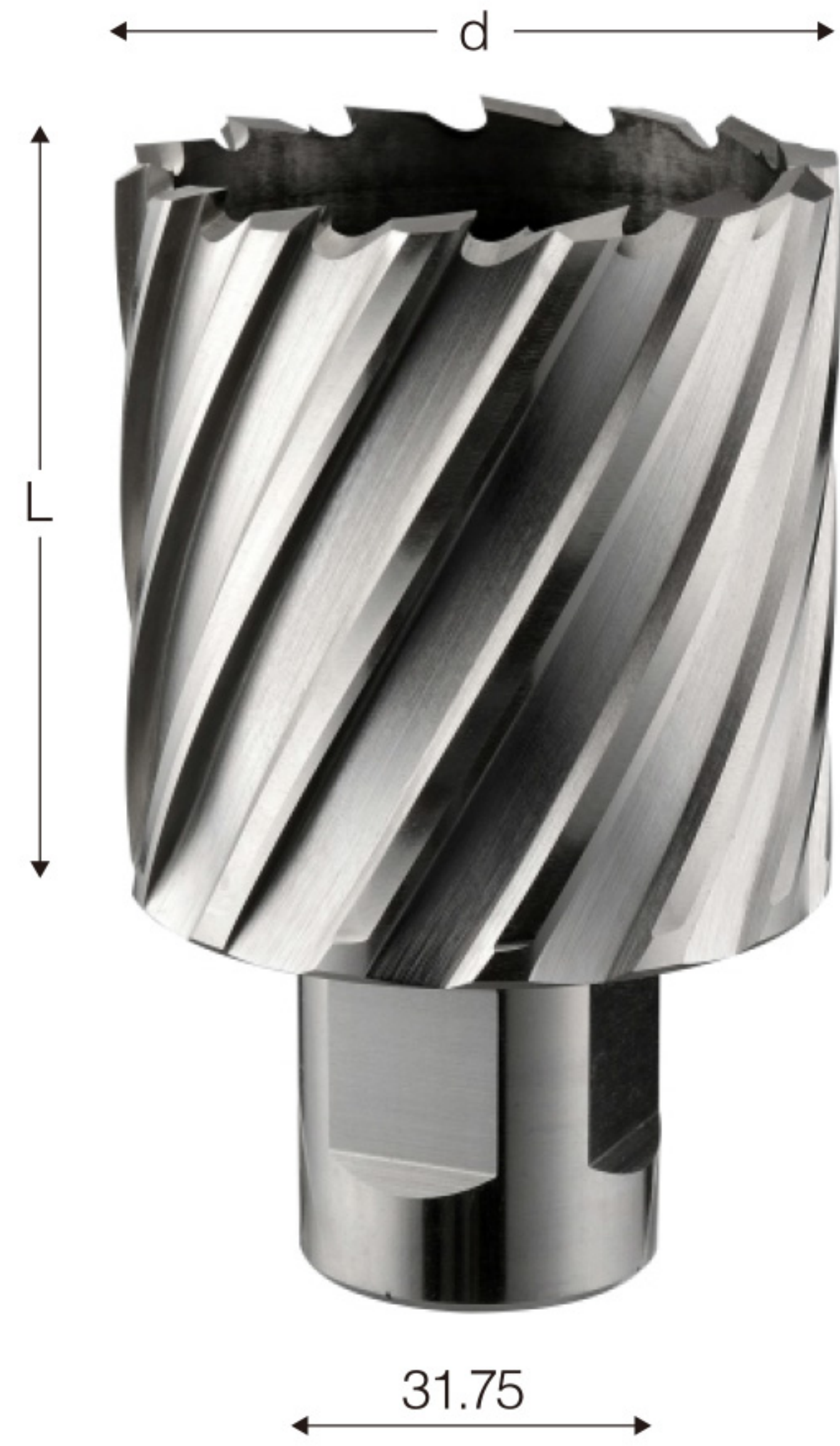
d:直径 d: Diameter L: 钻孔的深度 L: Cutting depth