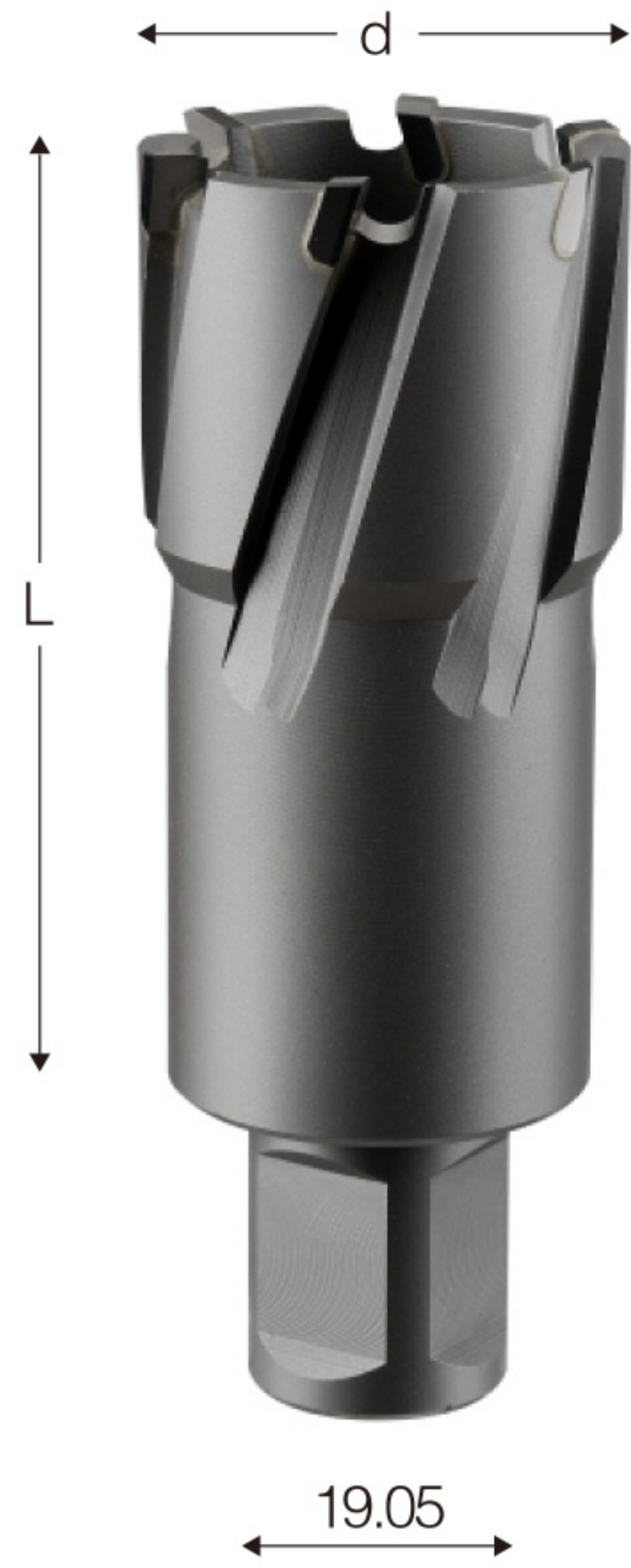
d:直径 d: Diameter L: 钻孔的深度 L: Cutting depth

» 安装示意图: Installation schematic diagram: