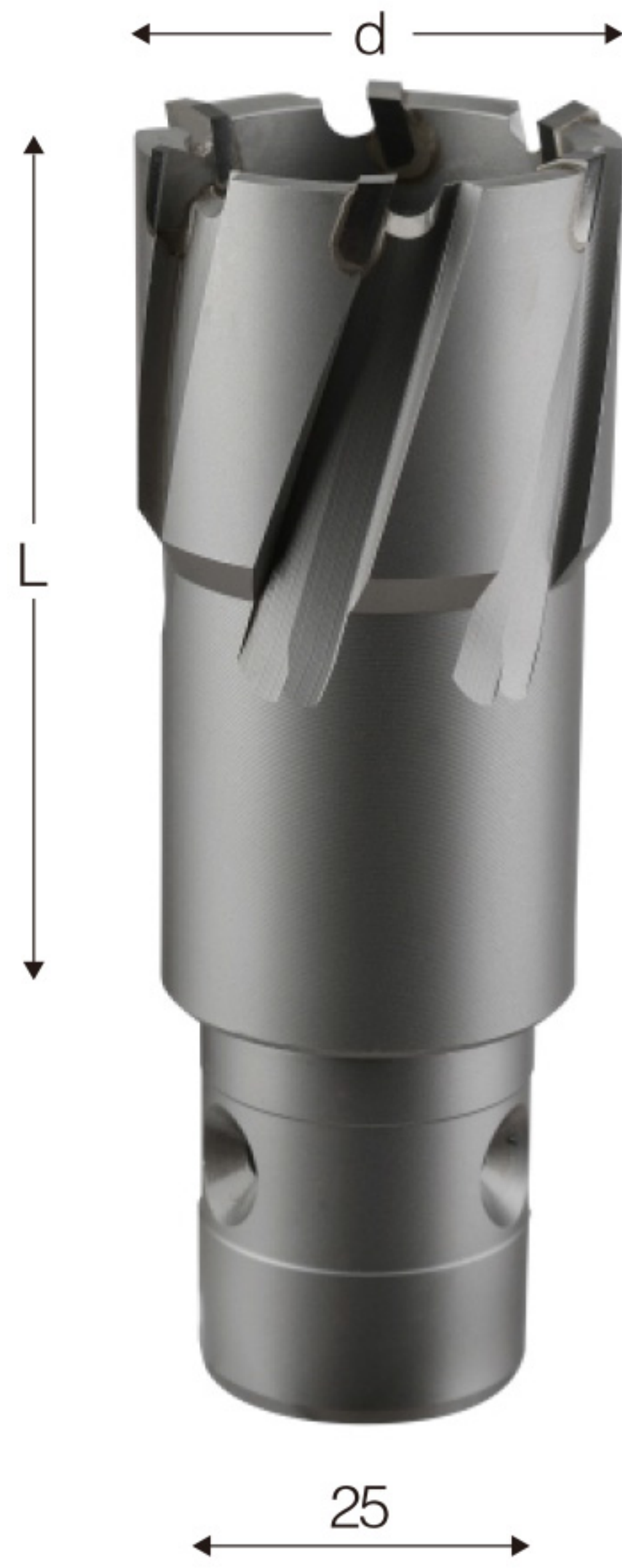
d:直径 d: Diameter L: 钻孔的深度 L: Cutting depth